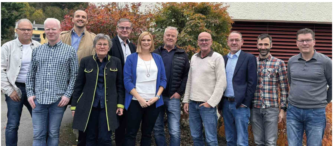
Stiftungsrat & ZPK 2023-2025

Es resultierte ein Gewinn von CHF 26'919 (Vorjahresgewinn CHF 103'308) = - 74 %