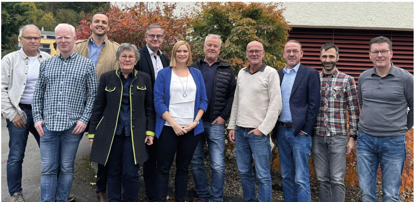
Stiftungsrat & ZPK 2023-2025

Es resultierte ein Gewinn von CHF 103'308 (Vorjahresgewinn CHF 22'836).